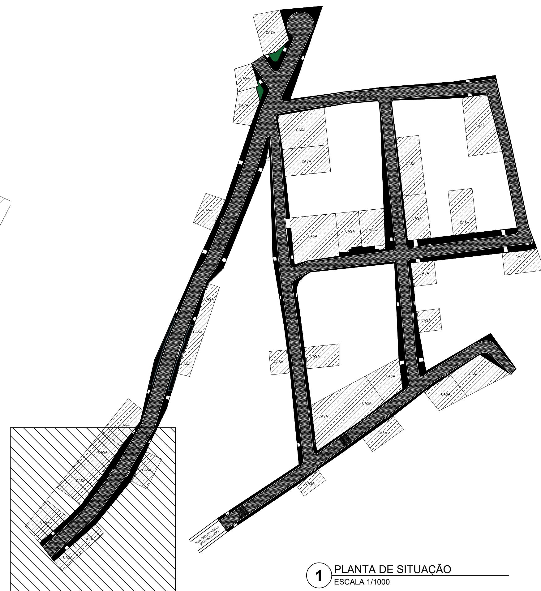
1 PLANTA DE SITUAÇÃO ESCALA 1/1000